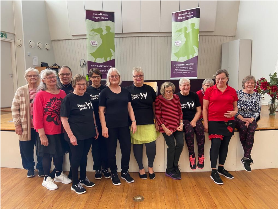
Kuvassa Happy Dance ryhmä.