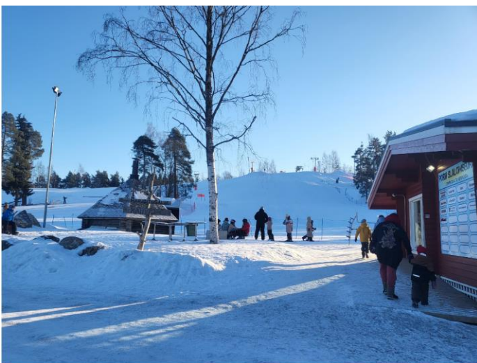
Kuvassa Ruosniemen hiihtokeskus