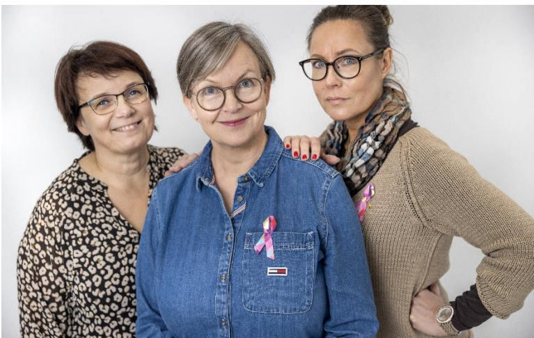
Kuvassa Satakunnan syöpäyhdistyksen sairaanhoitajat.

Meillä tukea tarjotaan sairastuneen potilaan lisäksi hänen läheisilleen. Vastaanottokäynnille on mahdollista tulla koko perheen kanssa. Lisäksi sairaanhoitajamme tekevät kotikäyntejä koko maakunnan alueella. Meillä psykososiaalisen tukeen kuuluvat myös vertaistuki sekä terapiapalvelut, joita ovat taideterapia ja lyhytterapia. Asiakkaamme määrittelevät itse tuen tarpeen ja keston, emme tee mitään potilaskirjauksia ja keskustelut ovat luottamuksellisia.