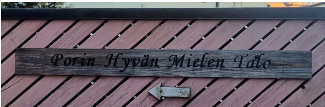
Kuvassa Hyviksen ulko-ovi, jonne ajoon on vaikea löytää.